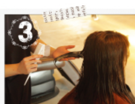
揉み込みながらトリートメントを塗布 CMCを補修