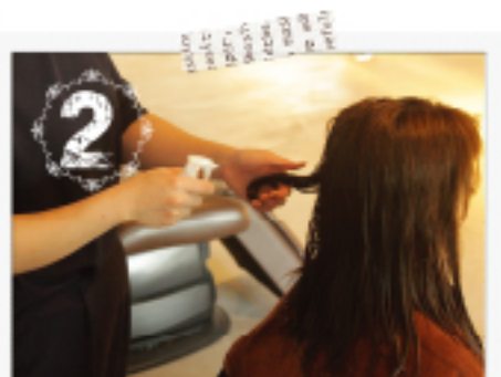
トリートメント成分の導入経路を広げ、 同時にコルテックスを補修