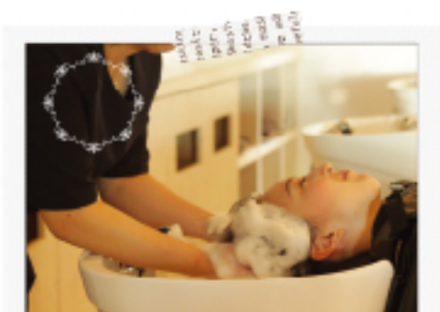
お一人お一人のお悩みに適した シャンプーを使い、丁寧に洗います