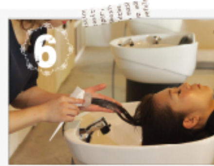
余分なトリートメントを流し 最後にキューティクル補修