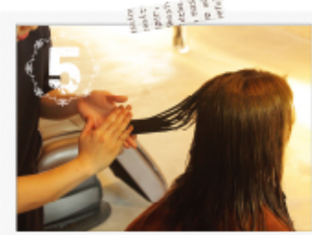
なめし技術でなめらかに整え 髪の深層まで押し込みます